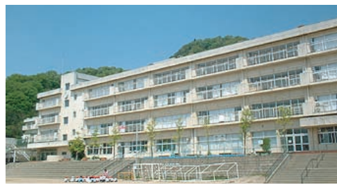
宝塚市立逆瀬台小学校

子供たちの成長を支える教育現場においても、加速度的に進むIT導入。しかし安心してコンピュータを利用するためには、セキュリティの確保が重要な課題となります。そこで宝塚市立教育総合センターでは、宝塚市立逆瀬台(さかせだい)小学校を初めとする市内の小、中、養護学校にスマート認証対応無線LANシステム「NetSkylink」を導入。重要な情報を確実に保護すると同時に、先生方の作業効率アップに役立てています。また教育総合センターの研修室では、教職員向けの研修業務にカスタムメイド対応パソコン「LPC」シリーズや強化ガラス製保護フィルタ内蔵TFT液晶モニター「LCM-TP」シリーズを活用。ロジテックのトータルソリューションが、先端IT教育の実現を強力にバックアップしています。