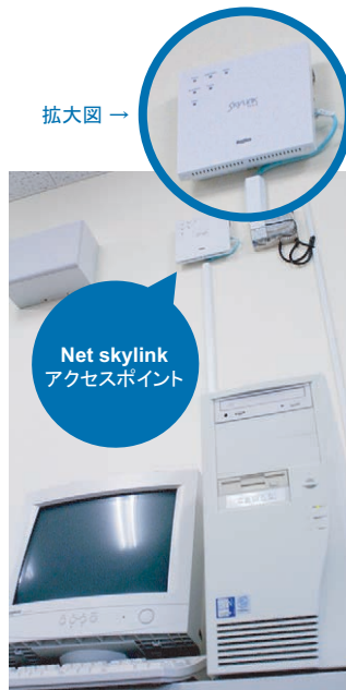
Net skylink アクセスポイント